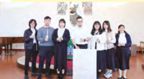
2025年度學生會就職禮

信神的師生和同工來自不同國家及地區，而去年我們在這大家庭內推動各成員互相認識，彼此尊重及欣賞對方的文化，雖有挑戰，但效果不俗，來自不同地方的成員之互動明顯增加了。今年我們不單希望繼續在這方面的推動，而且嘗試把焦點從文化這一環推進至每位成員所擁有的不同特質。來自同一文化的人，固然有相類似的特質，但他們之間同時都會有着不同。不同的年齡層、成長背景和教會背景，加上個人的性格和恩賜等等，都會讓我們彼此間存有差異。孔子在《論語·述而》中道：「三人行，必有我師焉。」對於我們這羣在神學院受造就的人，自當珍惜上帝所給予信神有這麼多不同的人一起同行的這份特質，因為透過聆聽與自己不同的人的故事，聆聽上帝在他們生命裏的作為，是一種能擴闊我們眼界的學習；透過與自己不同的人一起合作和生活，是一種能讓我們在生命及待人處事上愈催成熟的鍛鍊。