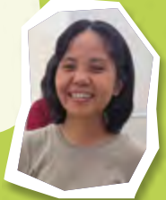
Eh Khu (緬甸)

第一次在香港茶樓吃飯，我真的驚訝——原來熱茶是用來「洗杯洗碗」的！這個茶水消毒儀式讓我見識到香港人對衛生的講究，也慢慢覺得這習慣挺不錯的！