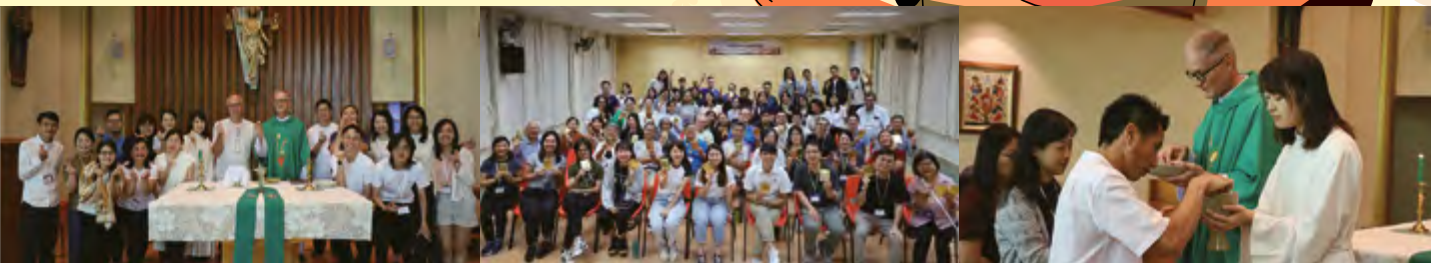
上圖:(左中右) 2025年秋季師生退修營