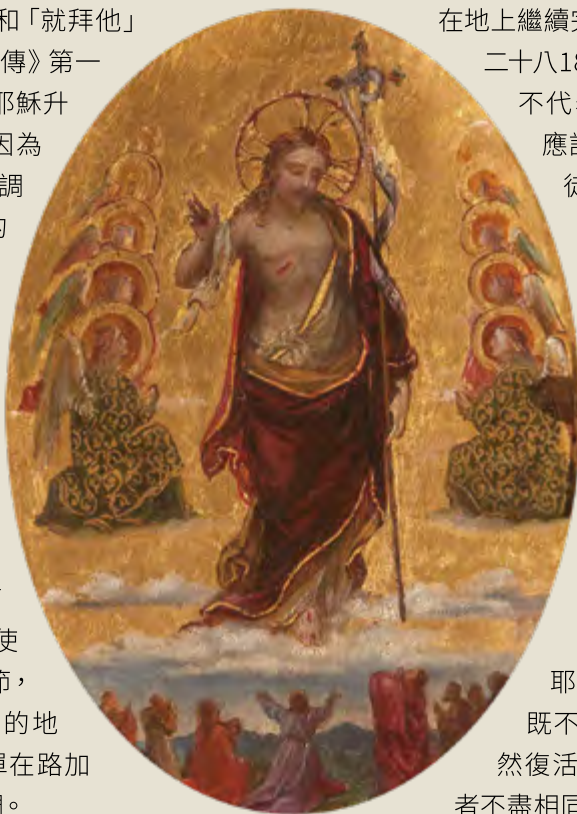
上圖：The Risen Christ (The Ascension), Rebecca Dulcibella Orpen, 1877, United Kingdom's National Trust

耶穌的升天是一個耶穌既不存在卻同在的表述。雖然復活與升天緊密相連，但二者不盡相同。前者與耶穌的受難與受死緊扣，著重救贖信息；後者以圓滿復活的主耶穌向門徒顯現作結束。而後來信經則以主耶穌現已坐在上帝的右邊，表述這個充滿榮耀與權能的意象，包含上帝為祂平反、使祂得勝，成為上帝與人之間的中保，叫人藉著信靠祂得以領受聖靈，並因祂的再來得永生的盼望。■