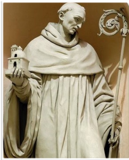
熙篤會的艾爾雷德像（網絡圖片）

of Rievaulx) 而言，友誼卻是上帝之愛的聖禮。屬靈友誼是幫助我們達致愛中成長的一種神聖關係；藉此，彼此的愛和對上帝的愛能不斷地成長。信徒的友誼實際是一種關係靈修，即除了婚姻親密合一的關係外，純潔、平等的友情，亦可以讓我們能夠更明白及親近上主。