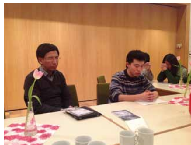
於德國留學的的中國學生

十年在比利時留學，十年在信神事奉，十年在德國宣教，教我們繼續仰賴主的恩典！願榮耀頌讚歸給聖父聖子聖靈三一真神，祂在歷史中行了大事，昔日如是，今天如是，將來也如是！