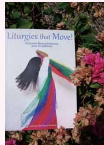
Liturgies that Move! $20

為大家率先介紹的是，由本院榮譽教授李嘉恩博士及前任教授向素文博士合著的作品。此書為禮儀手冊，以簡單的流程、肢體動作的配合，幫助信徒口唱心通的敬拜神。書中更有李博士的畫作，可供讀者於欣賞畫作時，同時默想其義。