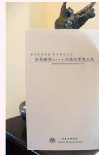
李景雄博士 八十五華誕賀壽文集 $120

為大家率先介紹的是，由本院榮譽教授李嘉恩博士及前任教授向素文博士合著的作品。此書為禮儀手冊，以簡單的流程、肢體動作的配合，幫助信徒口唱心通的敬拜神。書中更有李博士的畫作，可供讀者於欣賞畫作時，同時默想其義。