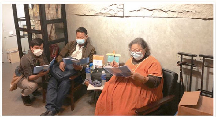
到香港電台的錄音室錄製崇拜廣播