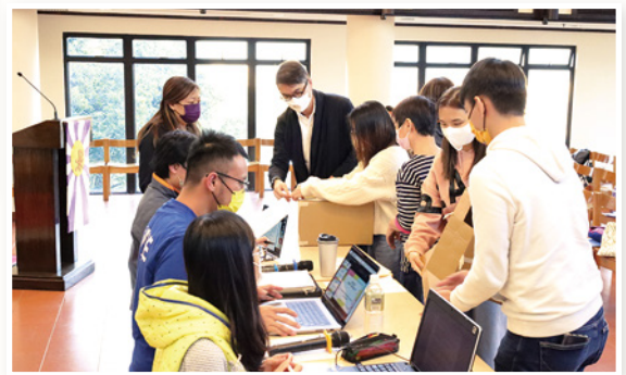
學生會周年會員大會