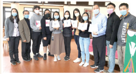
神學與生活簽書會

在現今重聲畫、輕文字的世代，願上帝幫助我們繼續促進本色神學探索與著述，推動中文神學寫作！