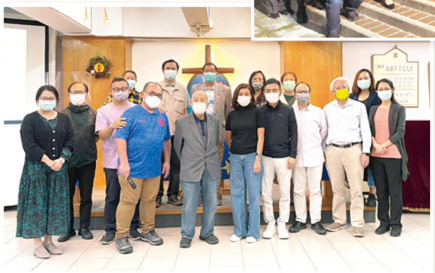
校友會周年會員大會